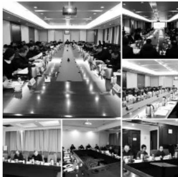
图 1 会议现场

中国石油和化工勘察设计协会技术开发部主任孙复斌主持会议，并对标准制（修）订工作提出了具体要求：应当在科学技术研究成果和社会实践经验的基础上，深入调查研究，广泛征求意见；保证标准的科学性、规范性、时效性，提高标准编制质量。蓝星工