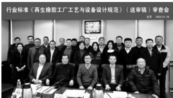
图2 行业标准《再生橡胶工厂工艺与设备设计规范》(送审稿)审查会