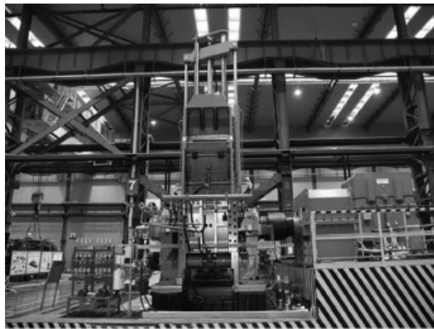
中化橡机益阳基地生产的 GN700 高压永磁剪切型密炼机

2024 年 12 月 27 日，中国石油和化学工业联合会委托全国橡胶塑料设计技术中心组织召开了由益阳橡胶塑料机械集团有限公司自主完成的“超大容量 GN700 高压永磁剪切型密炼机”科技成果鉴定会并一致通过。