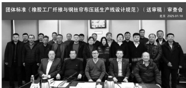
图3 行业标准《橡胶工纤维与钢丝帘布压延生产线设计规范》(送审稿)审查会