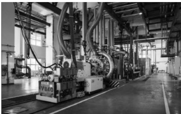
35 万吨聚丙烯挤压造粒机组

2024 年 9 月，由大连橡胶塑料机械有限公司承制的国内首套 35 万 t/ 年聚丙烯挤压造粒机组项目通过中国石化科技成果鉴定。该项目是我国“十三五”石化重点攻关项目，也是中石化“十条龙”科技攻关项目之一。