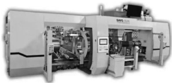
萨驰智能化半钢子午胎一次法成型机

2024 年 9 月 11 日，萨驰智能隆重发布了轮胎工业核心装备半钢一次法成型的以旧换新方案，以响应